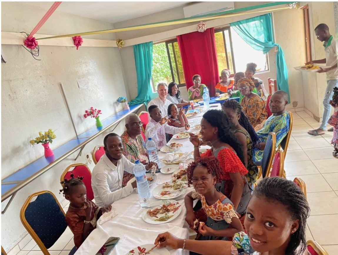
Déjeuner spécial ensemble à Cotonou

Après le déjeuner, de nombreux membres et enfants ont fait une belle promenade le long de l'océan.